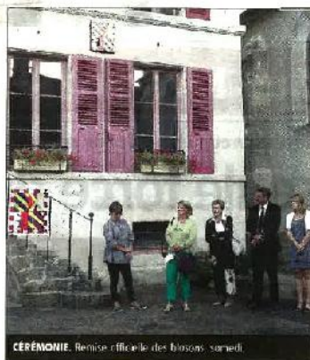
CEREMONIE. Remise officielle des blasons samedi.

En émaux de Briare Elles ont été réalisées en émaux de Briare pour leurs qualités de résistance aux intempéries : dans une gamme harmonique et brillante correspondant aux couleurs exigées et collées sur un panneau de