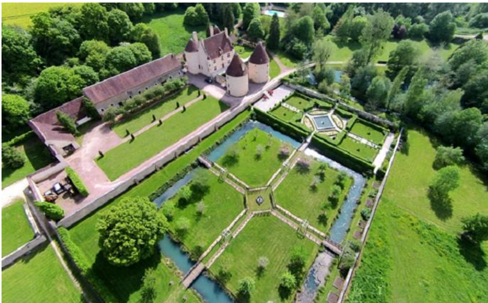
Jardin du château de Corbelin

N'oublions pas le sacrifice d'un enfant de la Chapelle, le brave CHANIAL, qui le 24 thermidor An 4, au prix de sa vie, arrêta l'armée Autrichienne en coupant un pont, sauvant ainsi ses compagnons d'armes.