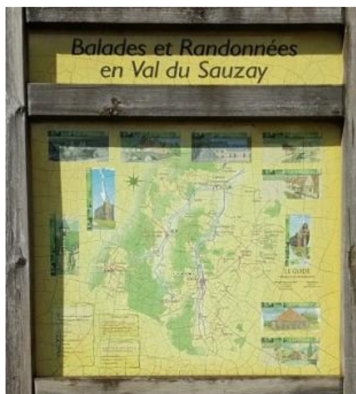
Le panneau se situe devant la mairie.