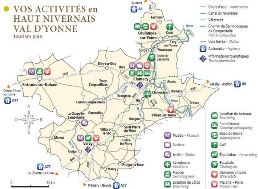
Carte du Haut Nivernais Val d'Yonne