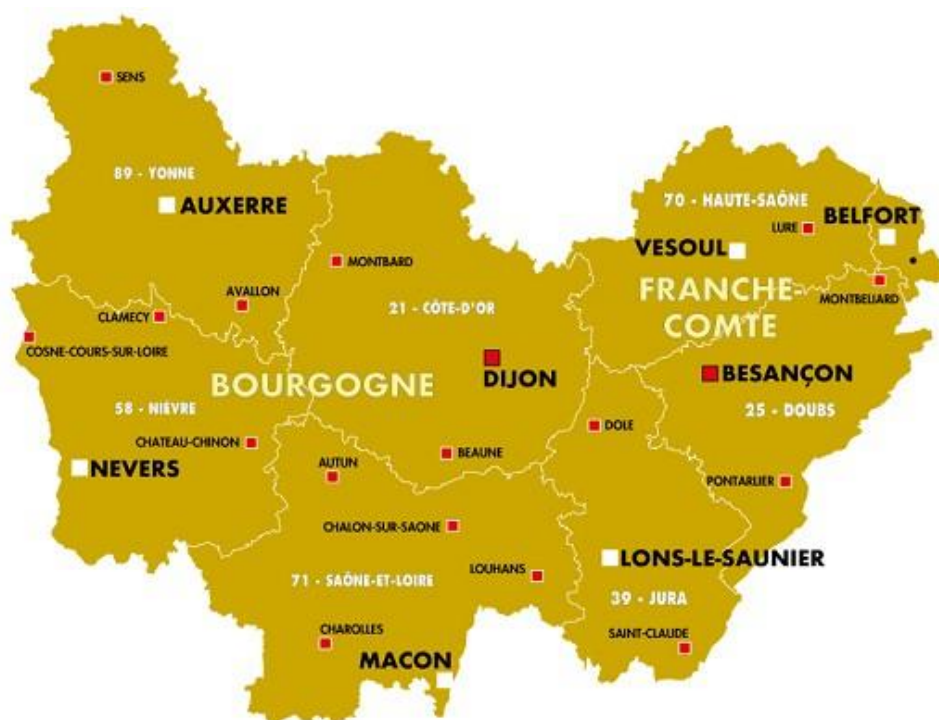
Carte de la Bourgogne - Franche-Comté